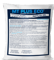
Pastilha em Gel