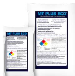
Dicloro 40% Estabilizado