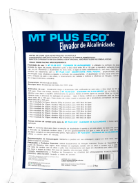
Elevador de Alcalinidade