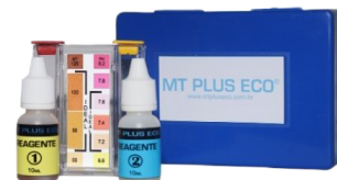
kit reagentes Desinfetante