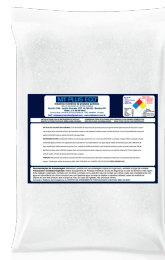
Sulfato de Alumínio