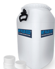
Pastilha de Cloro 90% 200g