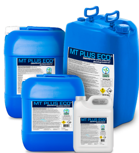
Mt Plus Eco Desinfetante Biodegradável