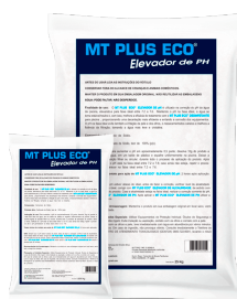
Elevador de Ph