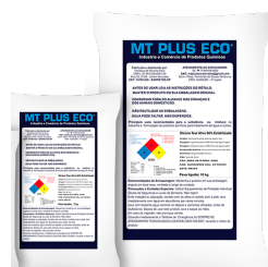
Dicloro 60% Estabilizado